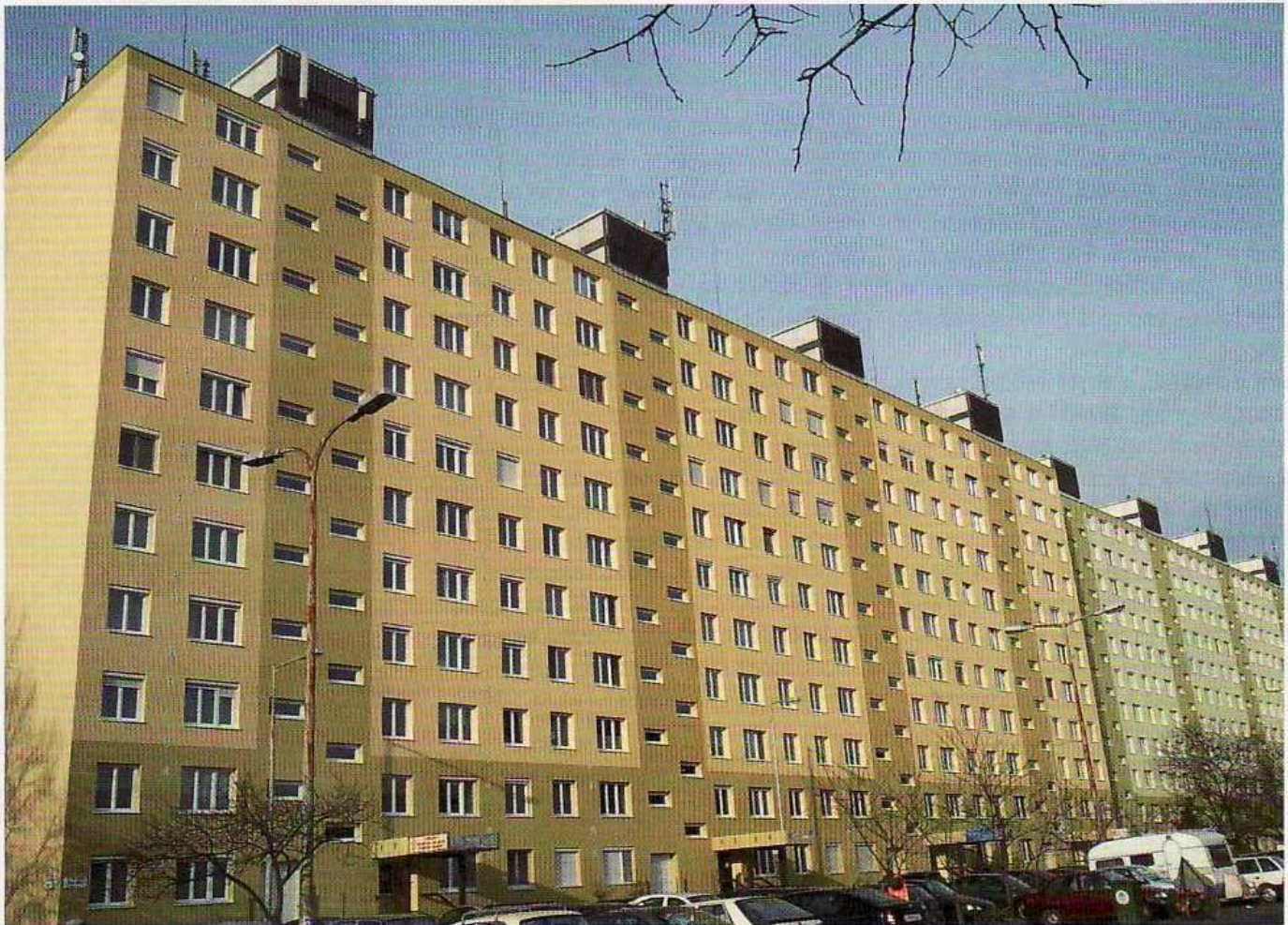
Mintaprojekt a főváros XIII. kerületében.

Minden feltétel adott ahhoz, hogy Magyarországon is elterjedjen az épületek fűtésének-hűtésének energetikailag leghatékonyabb módszere, a hőszivattyús technológia. Cikkünkben egy frissen megvalósult projekt egyéves tapasztalatairól számolunk be.